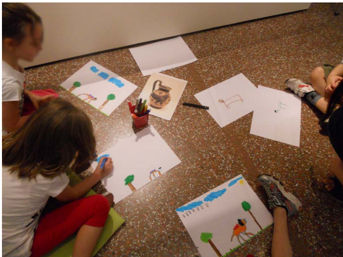
Εικόνα 2. Ζωγραφική στο μουσείο.