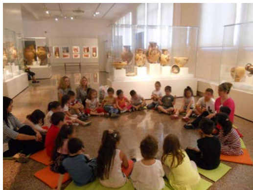
Εικόνα 1. Επίσκεψη στο Εθνικό Αρχαιολογικό Μουσείο