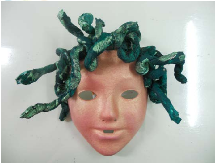
Εικόνα 3. Κατασκευή μάσκας Μέδουσας